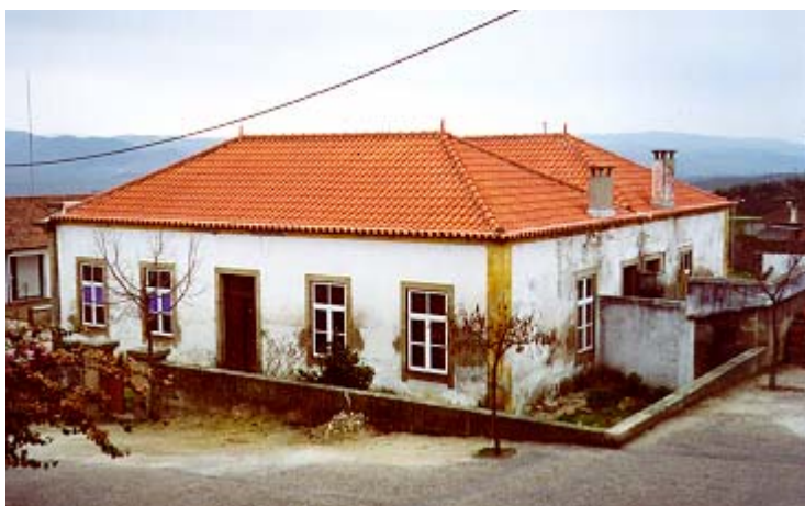
Figura 3 – Escolas Primárias de Santa Comba da Vilariça (2000)

O legado Conde Ferreira (1782-1866), com uma larga aplicação à construção de edifícios escolares, em todo o País, estendeu-se também a terras de Bragança. A circular de 04-01-1867, emanada do Governo Civil de Bragança, dá indicações para as câmaras do Distrito se poderem candidatar a um subsídio de 1 200$000 réis, do cofre do legado do Conde Ferreira, para auxiliar parte da construção de uma escola do ensino primário, ficando a outra parte da obra a cargo das câmaras requerentes 44 .